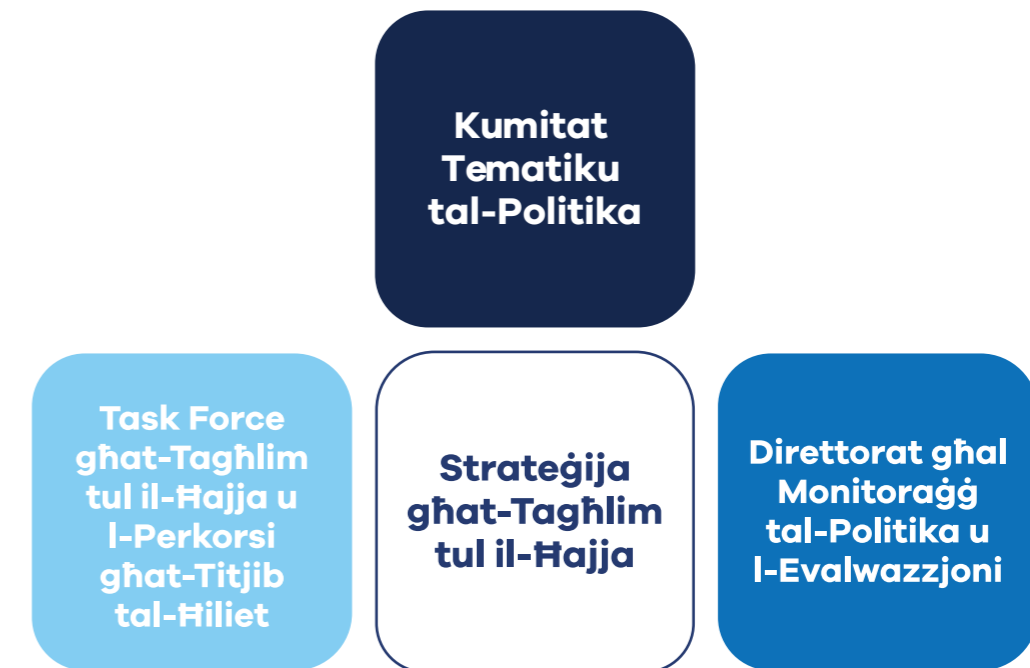
Illustrazzjoni 2: Sistema ta' monitoraġġ bi tliet saffi għall-kisba b'suċċess tal-għanijiet tal-Istrateġija għat-Tagħlim tul il-ħajja 2023-2030

It-task force mhijiex limitata biss għall-membri li ġejjin mis-settur tal-edukazzjoni għall-adulti, iżda tinkludi wkoll dawk interministerjali biex tiżgura rappreżentanza aħjar u perspettivi usa' minn setturi oħra. It-tieni saff huwa l-Kumitat Tematiku tal-Politika li jinħatar mis-Segretarju Permanenti u jara li l-miri qed jintlahqu fil-hin. Barra minn hekk, it-tielet saff huwa ffurmat mill-PMED fi hdan il-MEYR, fejn dan iżid livell Ministerjali ta' monitoraġġ peress li d-Direttorat għandu l-funzjoni li jimmonitorja l-miri kollha relatati mal-politika tal-MEYR.